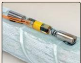
• Model 4151 Strain Gauge mounted to a fiberglass rebar.