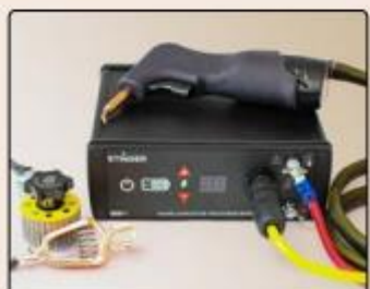
• Model 4100-WLD Stinger spot welding kit.