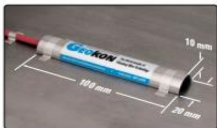
Modelo 4150 bajo la placa de cubierta protectora Modelo 4150-1, con dimensiones.