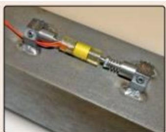
• Model 4150 shown with optional arc-weldable mounting blocks.